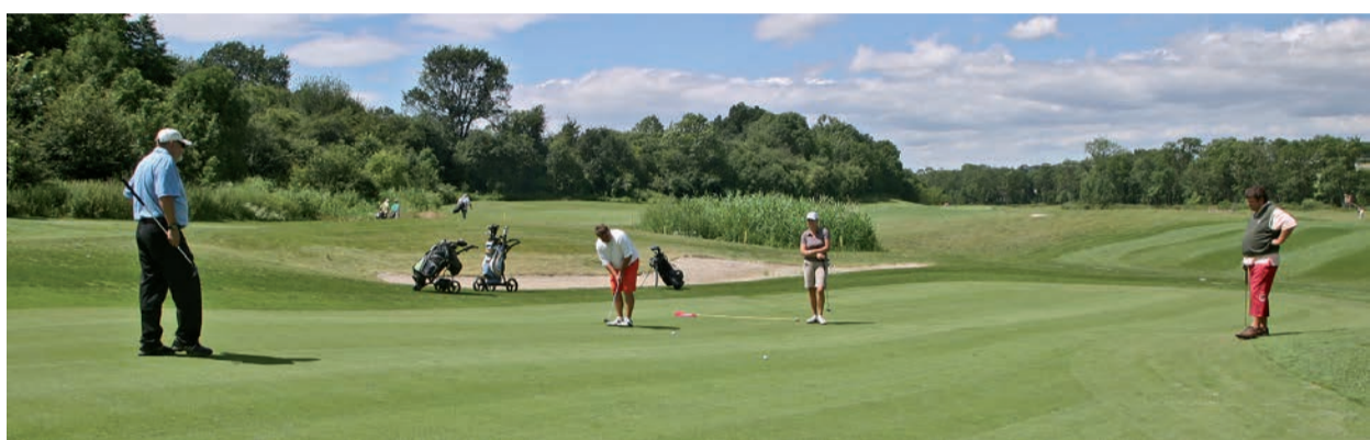
Osmá jamka v Bitozevsi

Bez vodních hladin by golfové hřiště bylo krajinotvorně nedotažené. Voda představuje herní i estetický prvek. „Ostrůvek mezi jamkami je úlitbou