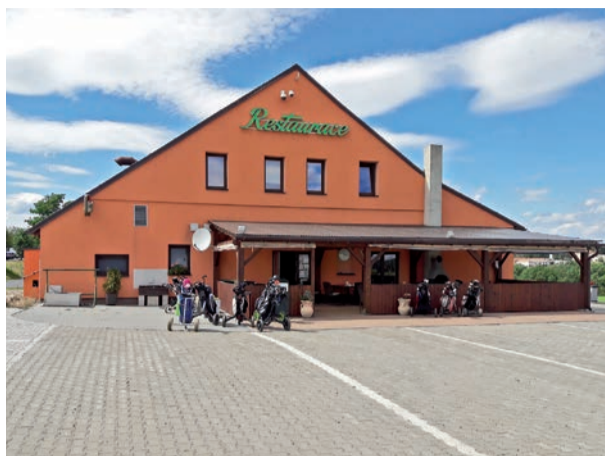
Klubovna místo někdejšího kravína

Investor měl podle jeho slov mnoho vhodných strojů i lidí. Nedaleká pískovna se šikovným majitelem a skvělymi velkokapacitními stroji